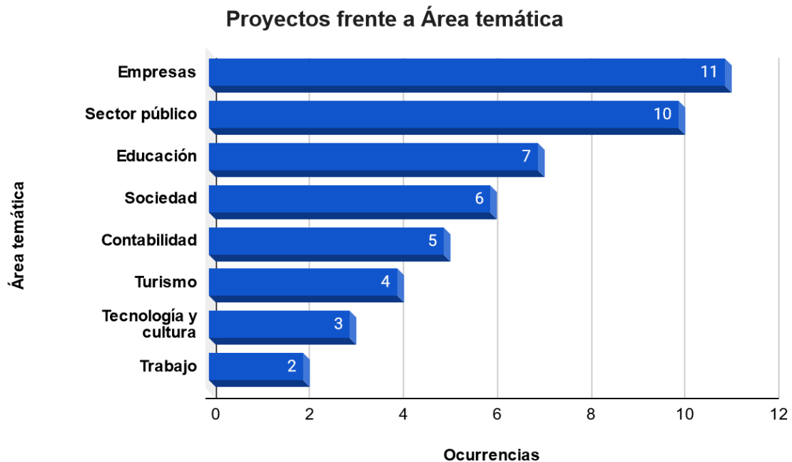
Gráfico 3: Cantidad de proyectos por áreas temáticas