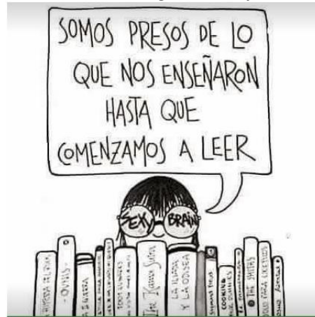
Ilustración 2. Meme bibliotecológico: «La frase de fin de semana»