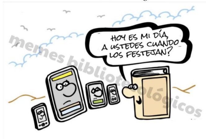
Ilustración 5. Meme bibliotecológico sin título