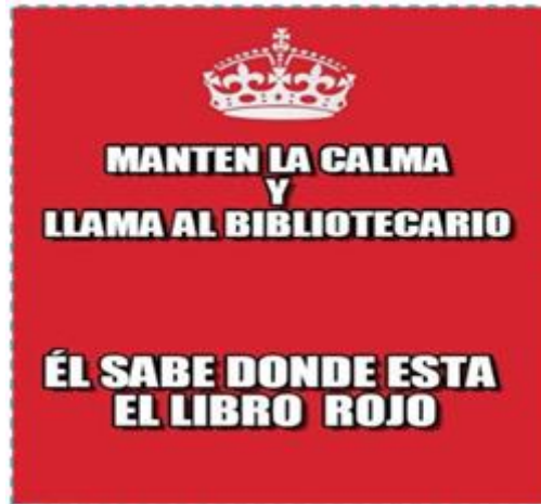
Ilustración 1. Meme bibliotecológico: «Tranquilo...nosotros acá estamos @_@»