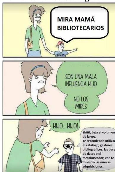
Ilustración 4. Meme bibliotecológico «Eso se pega»