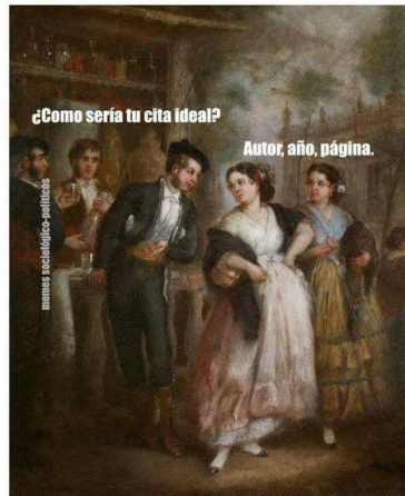
Ilustración 3. Meme bibliotecológico «¿Y tu cita ideal?»