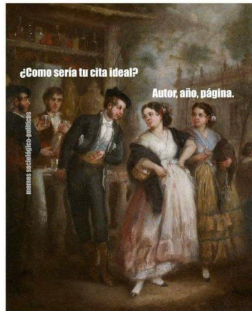
Ilustración 3. Meme bibliotecológico «¿Y tu cita ideal?»