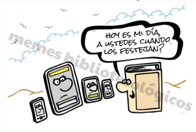
Ilustración 5. Meme bibliotecológico sin título