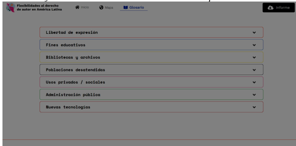
Gráfico 2: Glosario de la herramienta de mapas interactivos