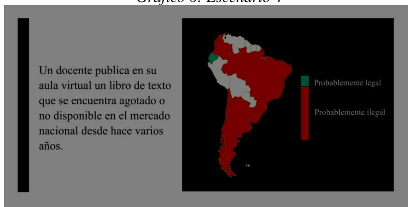
Gráfico 6: Escenario 4