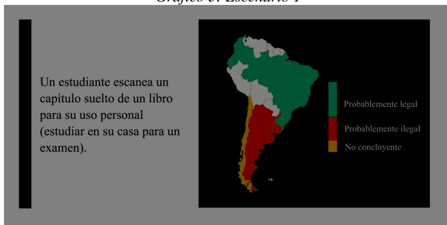
Gráfico 3: Escenario 1