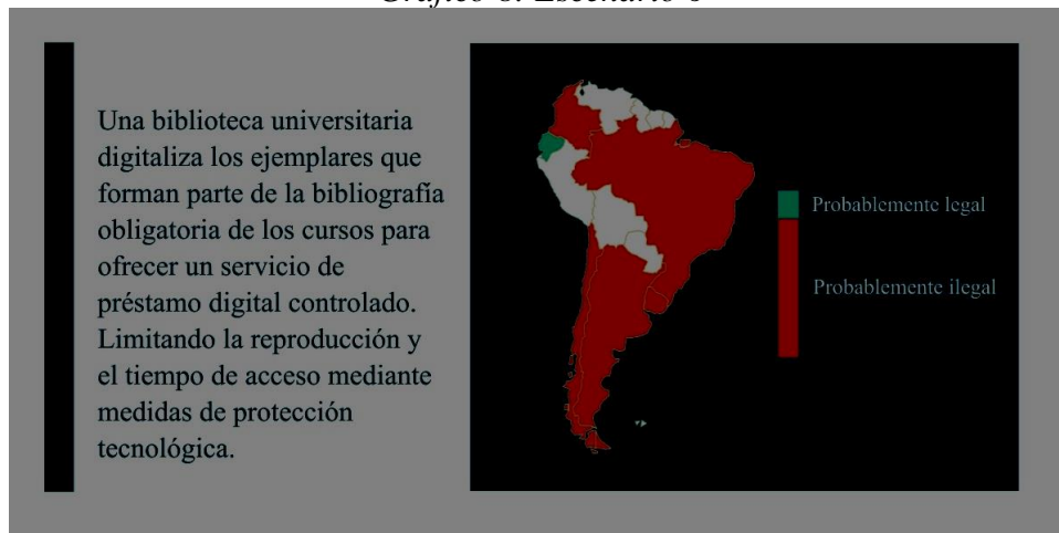
Gráfico 8: Escenario 6