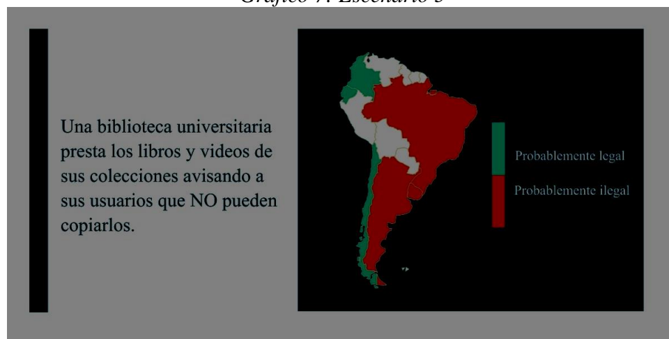
Gráfico 7: Escenario 5