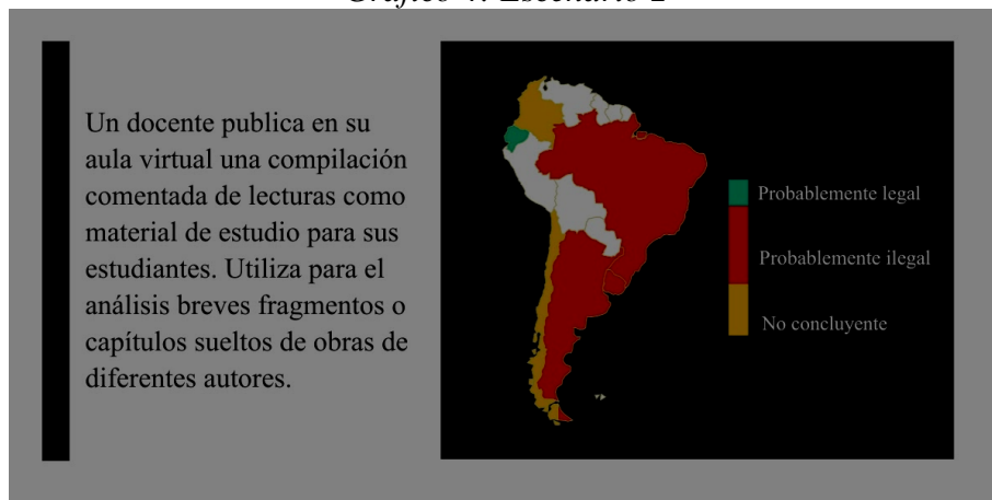
Gráfico 4: Escenario 2