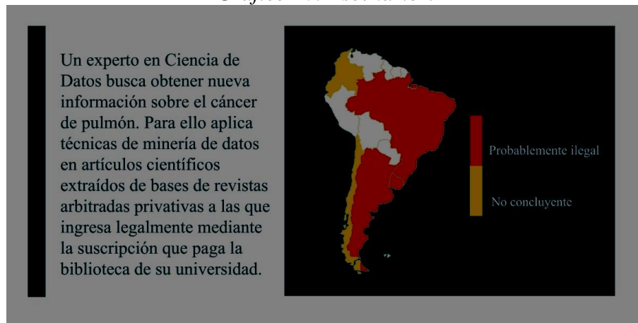
Gráfico 10: Escenario 8