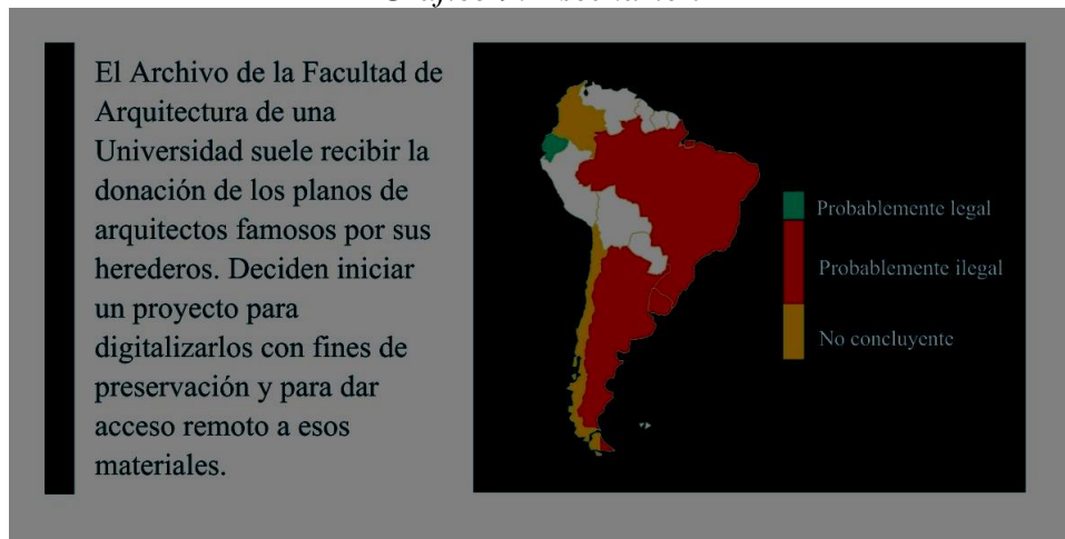
Gráfico 9: Escenario 7