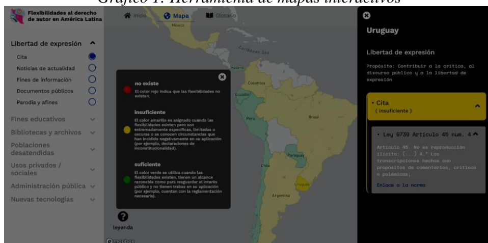
Gráfico 1: Herramienta de mapas interactivos